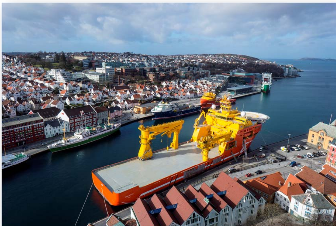
Viking Neptun – Stavanger